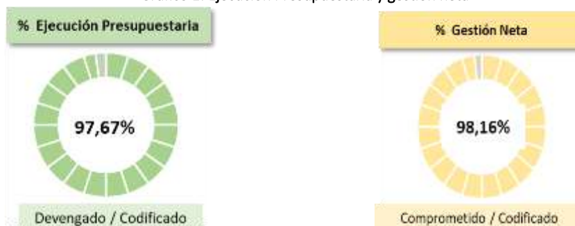
Gráfico 1: Ejecución Presupuestaria y gestión neta